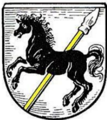
Fot. 2: Herb Pilchowic według Ottona Huppa