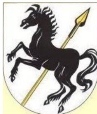
Fot. 3: Aktualny herb gminy Pilchowice