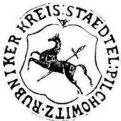
Fot. 1: Odris pieczęci Pilchowic z II połowy XIX wieku według Wilperta i Kutzera

Gmina Pilchowice posługuje się herbem wyobrażającym w polu srebrnym rumaka wspiętego czarnego, przesztygo włócznią złotą w lewy skos. Herb znany jest z XIX-wiecznych pieczęci. Odris jednej z takich pieczęci opublikowali Oskar Wilpert i Paul Kutzer. Barwną wersję tego herbu podał Otto Hupp i na jego opracowaniu bazuje aktualnie używany herb gminy Pilchowice. Herb ten uzyskał pozytywną opinię Komisji Heraldycznej przy MSWiA Uchwałą Nr 26-520/O/2002 z dnia 4 stycznia 2002 roku.